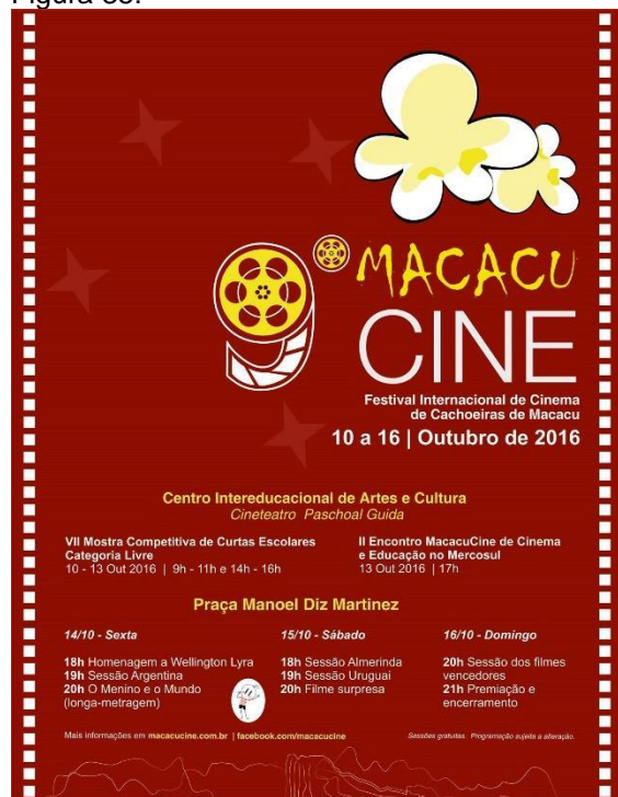
Cartaz do IX MacacuCine em 2016. (Imagem de arquivo do projeto)