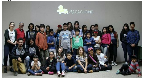
Sessão no Centro Cultural Brasil Argentina em 2016. (Imagem de arquivo do projeto)