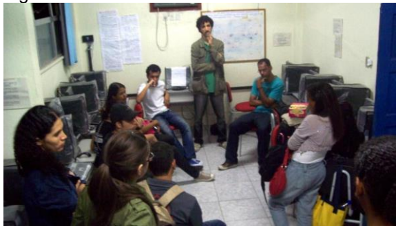
Foto da primeira Oficina MacacuCine em 2011.