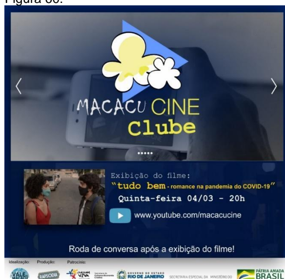
Divulgação de uma sessão do MacacuCineClube em 2021. (Imagem de arquivo do projeto)