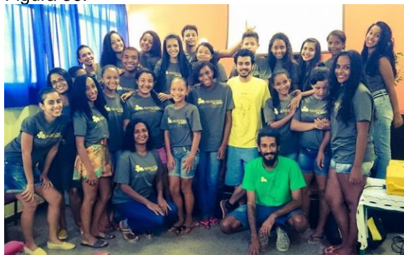
Alunos da turma de Artes Audiovisuais em 2016.