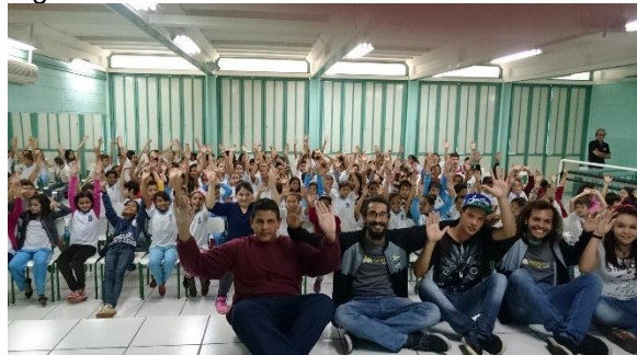
Sessões do MacacuCineMeira em 2015. (Imagem de arquivo do projeto)