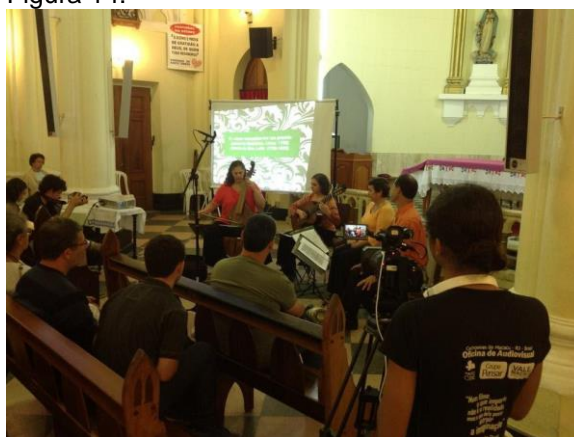
Registro do MacacuCine Lab em 2012. (Imagem de arquivo do projeto)