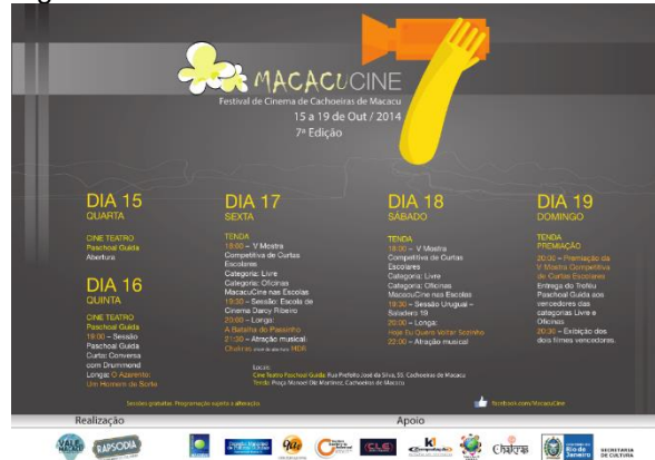
Programação do VII MacacuCine em 2014.