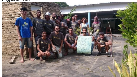
Equipe e participantes da Oficina de Audiovisual na Colônia Juliano Moreira em 2017.