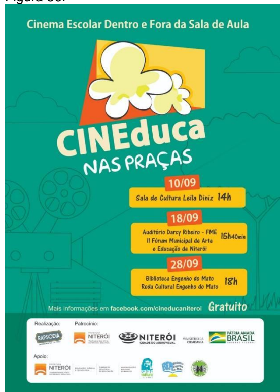
Cartaz CINEduca nas Praças com programação de setembro de 2019.