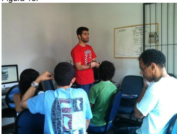
Oficina de Edição em 2012.