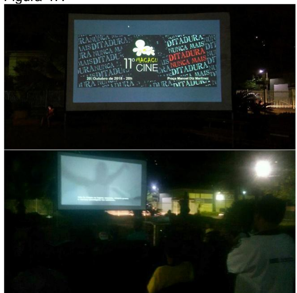
Imagens do XI MacacuCine em 2018.