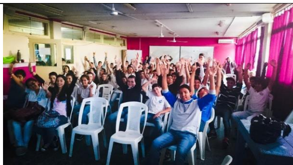
Alunos uruguaios assistindo às sessões do 19MacacuCine em 2015.