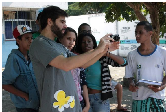
Alunos da Oficina de Audiovisual do MacacuCine em 2014.