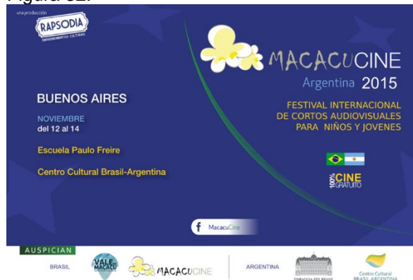
Cartaz do I MacacuCine Argentina em 2015. (Imagem de arquivo do projeto)