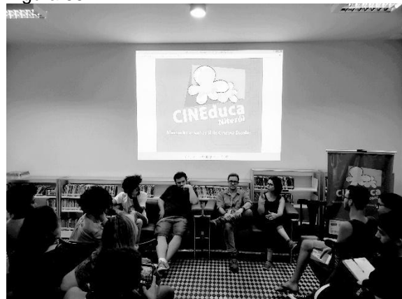
Encontro CINEduca de Audiovisual e Educação em 2019.