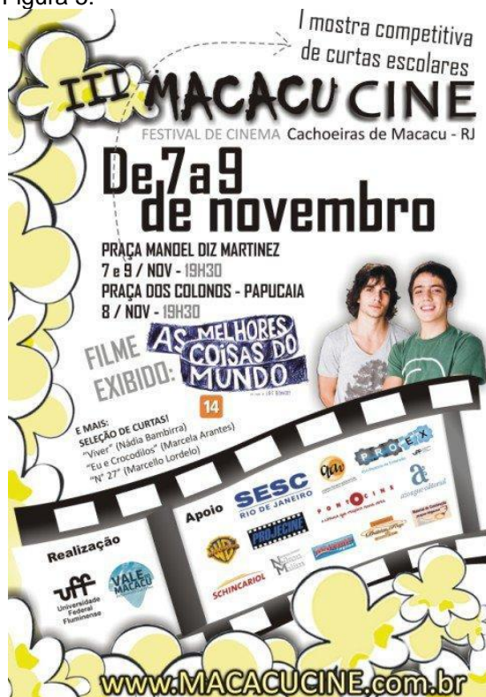
Cartaz III MacacuCine em 2010.