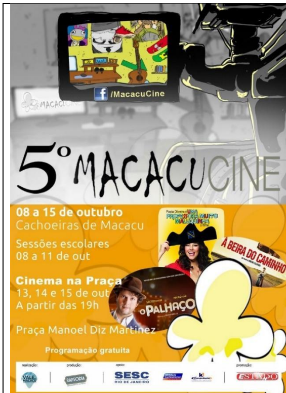
Cartaz V MacacuCine em 2012.