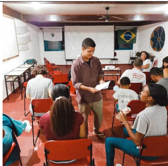
Imagem de uma sessão do MacacuCineClube em Serra Queimada em 2022.