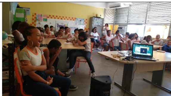
Sessão do CINEduca nas Praças em 2019. (Imagem de arquivo do projeto)