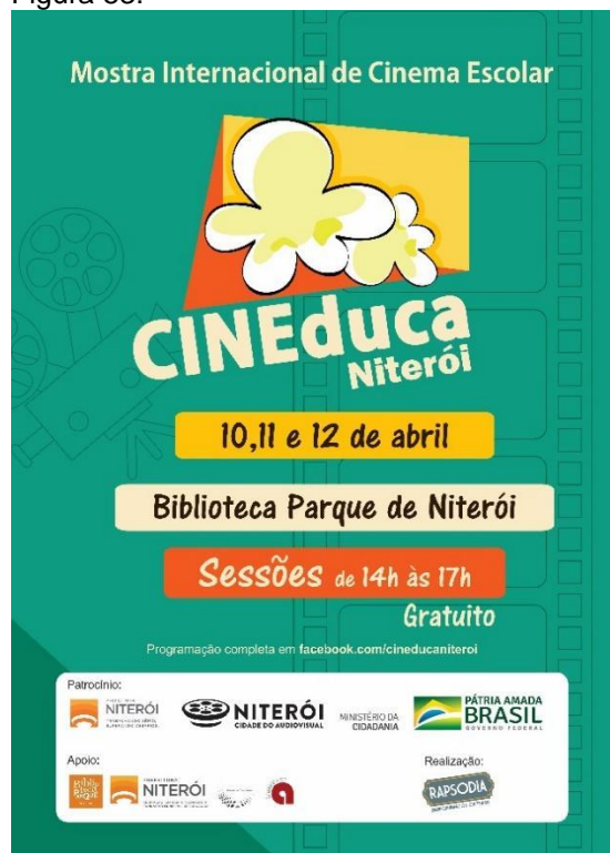
Cartaz do CINEduca Niterói em 2019. (Imagem de arquivo do projeto)