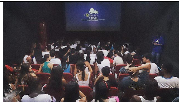
Sessões para alunos no Centro Cultural no VIII MacacuCine.