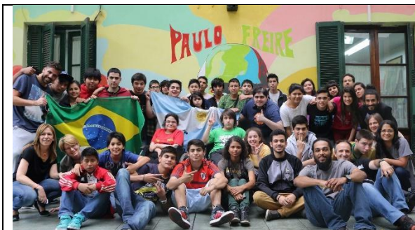
Alunos da Oficina na Escola Paulo Freire em Buenos Aires em 2015.