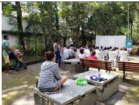
Sessão do CINEduca nas Praças em 2019.