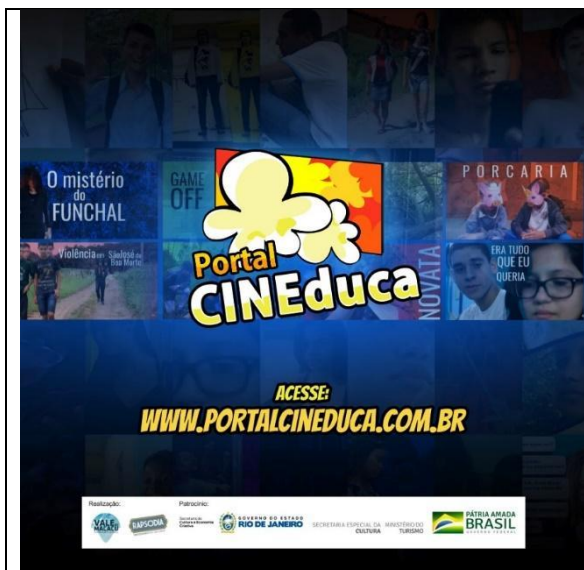
Divulgação do Portal CINEduca em 2021. (Imagem de arquivo do projeto)