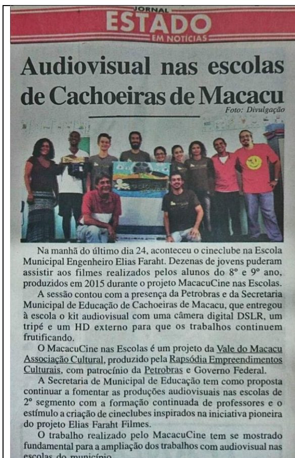
Matéria de jornal sobre as Aulas do MacacuCine em 2015.