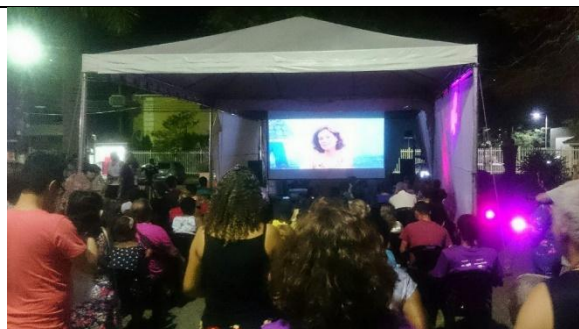
Público no X MacacuCine.