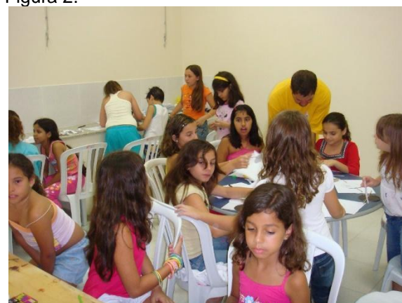
Crianças participando da Oficina de Animação no I MacacuCine.