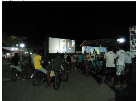
Público no III MacacuCine.