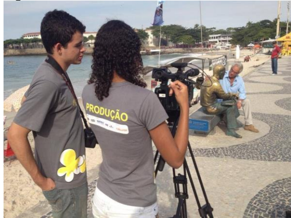
Gravação do Curta "Conversa com Drummond – Confissões de um Poeta" em 2013. (Imagem de arquivo do projeto)