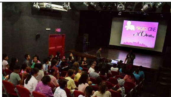
Crianças na sessão no Centro Cultural no X MacacuCine. (Imagem de arquivo do projeto)