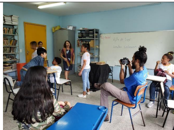
Alunos na Oficina de Audiovisual CINEduca em 2018.