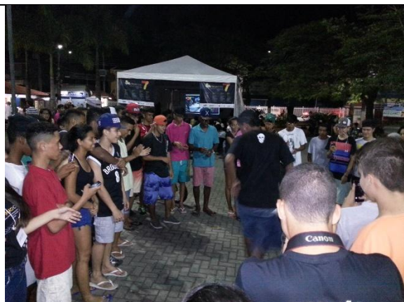
Público ensaia uma roda de passinho na praça. (Imagem de arquivo do projeto)