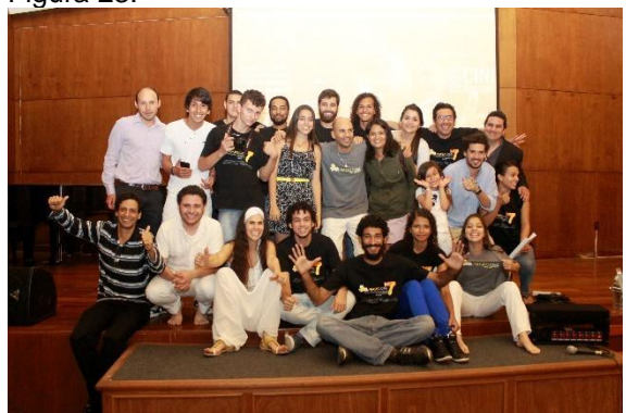
Equipe do 19MacacuCine em 2014.