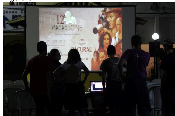
Equipe no XII MacacuCine.