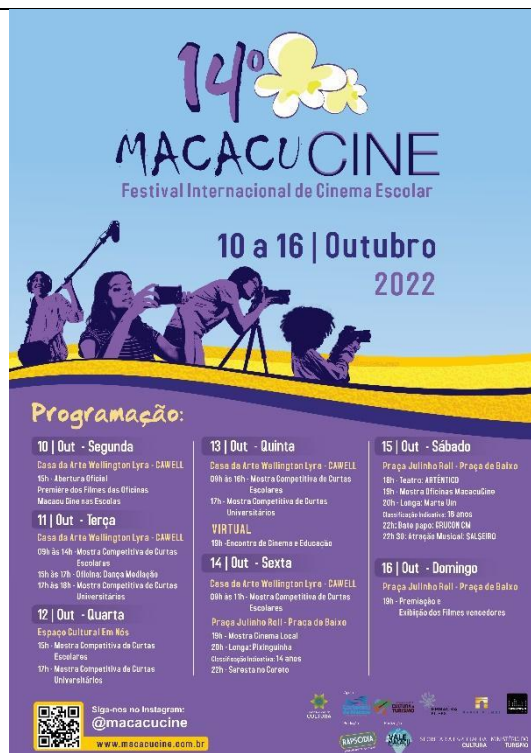
Cartaz XIV MacacuCine em 2022.