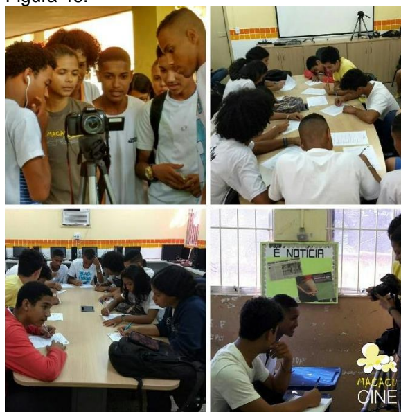
Imagens da Oficina de Audiovisual em Niterói em 2017.