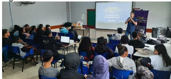
Sessão do Circula MacacuCine em 2022.