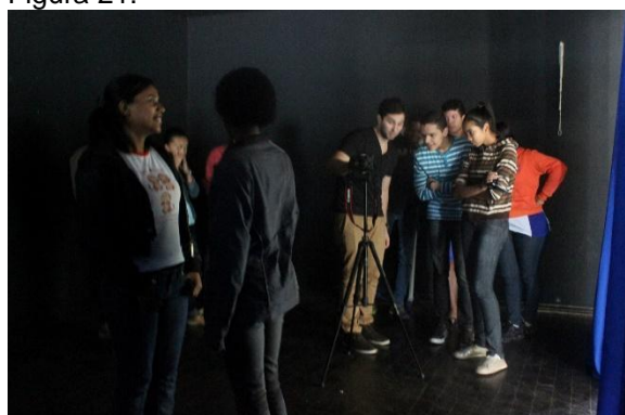
Alunos da Oficina de Audiovisual do MacacuCine em 2014.