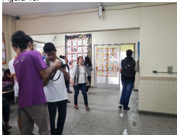
Alunos na Oficina de Audiovisual CINEduca em 2018.