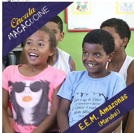
Sessão do Circula MacacuCine em 2022.