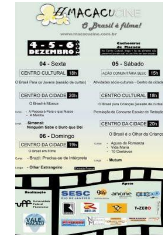
Cartaz II MacacuCine em 2009.