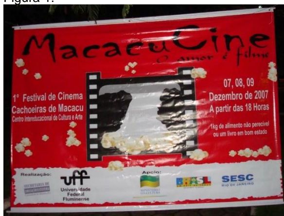
Banner I MacacuCine em 2007.