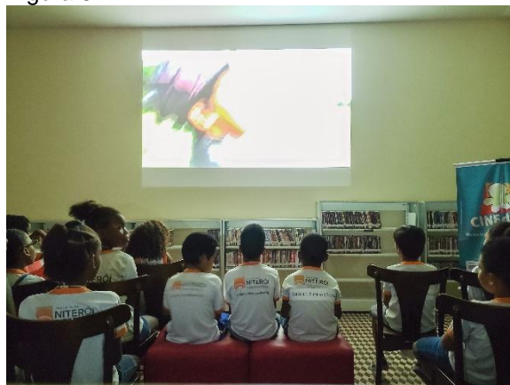
Exibição do CINEduca Niterói em 2019. (Imagem de arquivo do projeto)