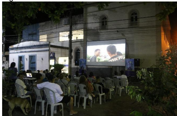
Público no XIV MacacuCine.