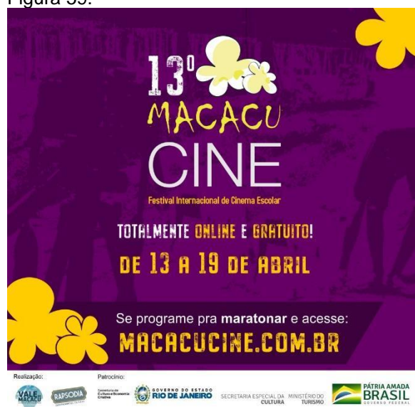
Divulgação do XIII MacacuCine em 2021. (Imagem de arquivo do projeto)