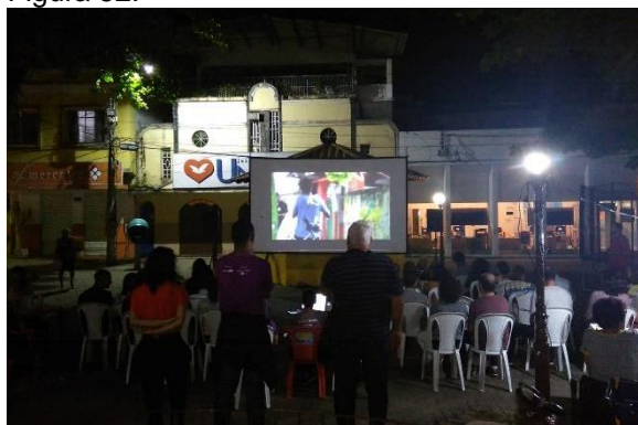
Público no XII MacacuCine.