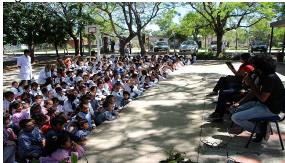
Sessões do 19MacacuCine em 2016 no Uruguai.