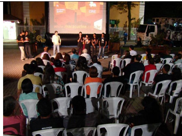
Público no IV MacacuCine.