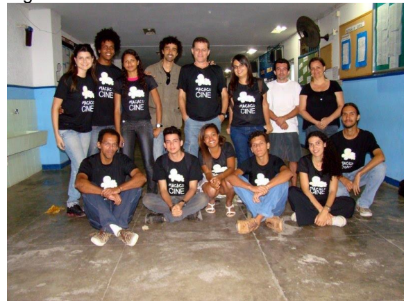
Foto da primeira Oficina MacacuCine.