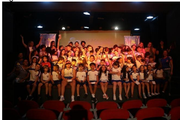
Público no XIV MacacuCine. (Imagem de arquivo do projeto)