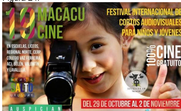
Cartaz do 19MacacuCine em 2014.