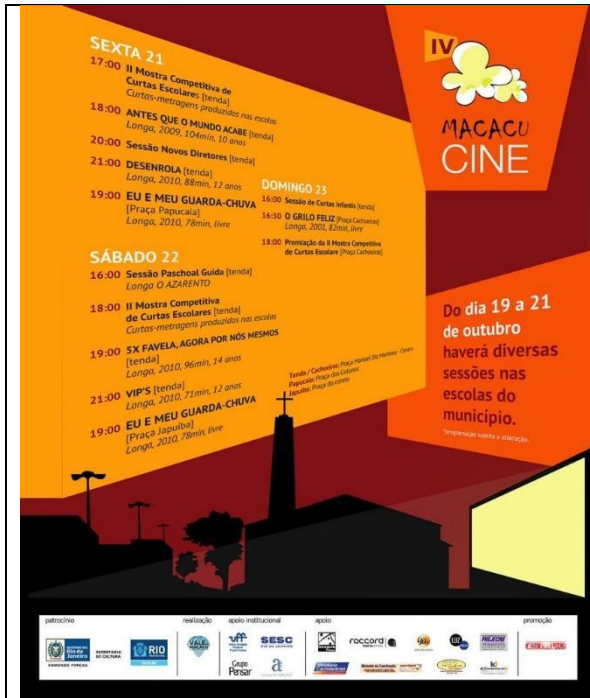
Cartaz IV MacacuCine em 2011.