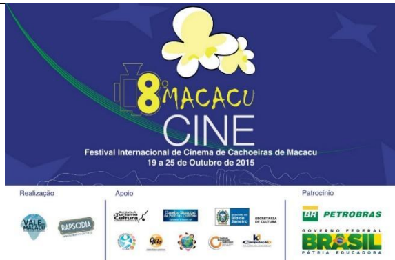
Flyer do VIII MacacuCine em 2015.