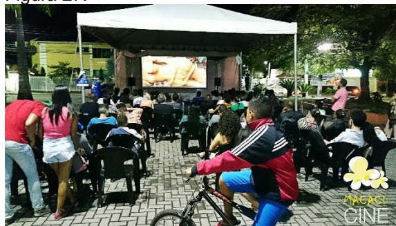
Público no VIII MacacuCine. (Imagem de arquivo do projeto)