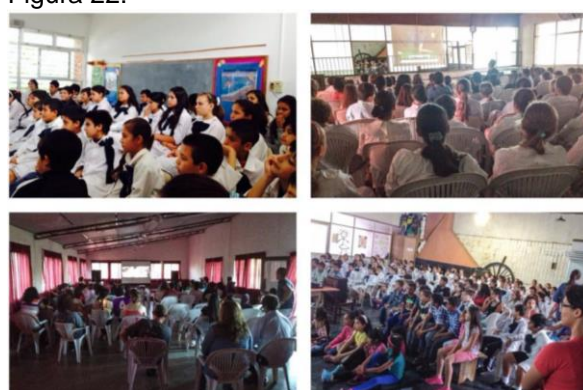
Alunos uruguaios assistindo às sessões do 19MacacuCine em 2014.