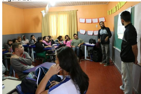
Alunos da Oficina de Audiovisual do MacacuCine em 2015.