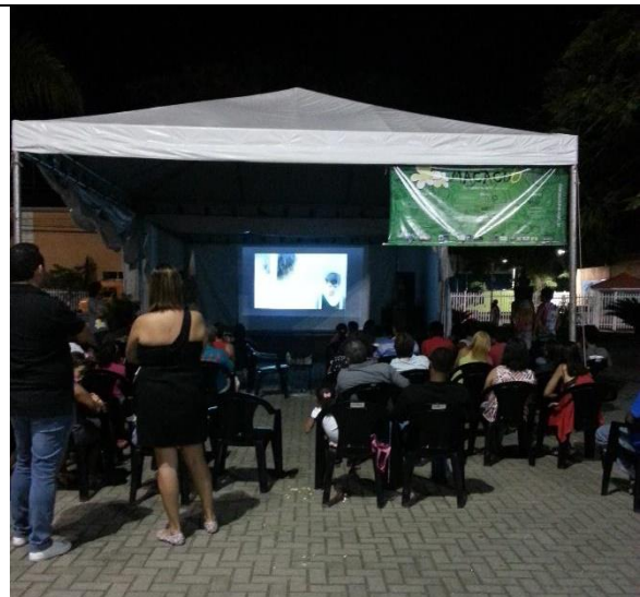
Público no VI MacacuCine.