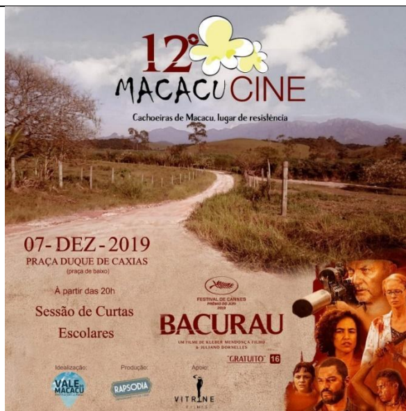
Cartaz do XII MacacuCine em 2019.